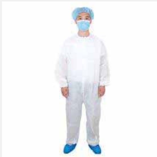
Zaštitna odjeća i obuća

Ako se koriste jednokratne rukavice, potrebno ih je mijenjati pri svakoj promjeni radnog procesa. Nakon uporabe, korištene jednokratne rukavice odlažu se u namjensku posudu za odlaganje otpada. Zabranjeno je ponovno korištenje već rabljenih rukavica. Ovisno o radnom mjestu zaposlenika radna obuća mora biti udobna, profesionalna i izvedena iz namjenskih materijala.