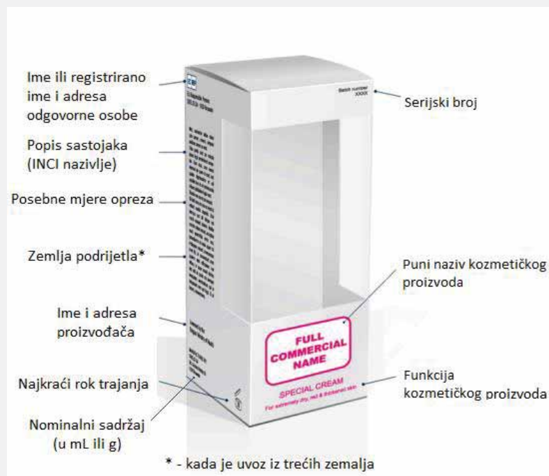
Označavanje kozmetičkih proizvoda