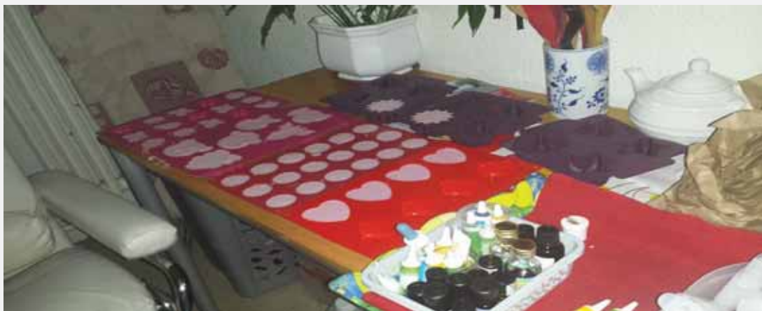
Dobar i loš primjer proizvodnje kozmetičkih proizvoda