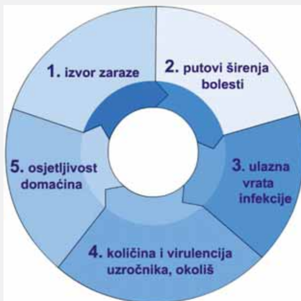
Epidemiološki ili Vogralikov lanac

Ako bilo koji od tih uvjeta nije zadovoljen doći će do prekidanja epidemiološkog lanca i do infekcije neće doći.