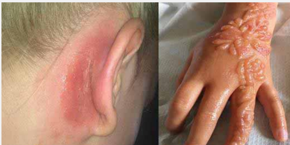
Primjeri ozbiljnih neželjenih učinaka - nuspojave kozmetičkih proizvoda

Ovakve slučajeve prijavljuju zdravstveni djelatnici, distributeri te proizvođači Ministarstvu zdravstva na elektroničku adresu: kozmetovigilancija@miz.hr