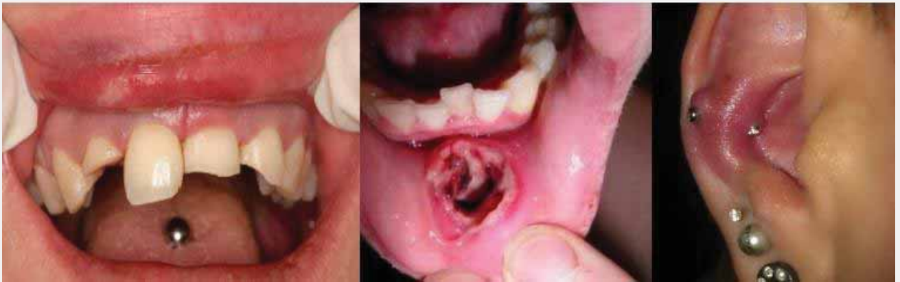
Komplikacije nastale nakon postupka piercinga