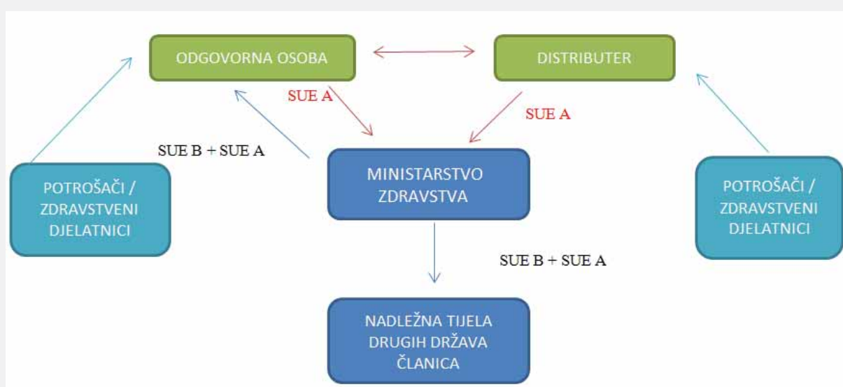
Prijava ozbiljnog neželjenog učinka odgovorne osobe ili distributera