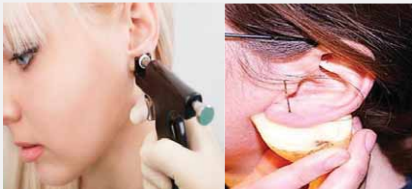
Dobar i loš primjer piercinga ušiju